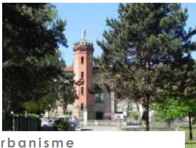
Plan Local d'Urbanisme