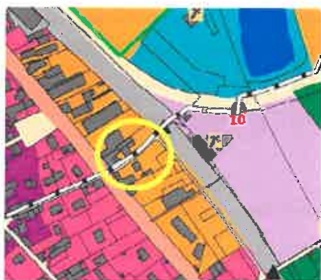
extrait de carte des enjeux de Loire/ Rhône avant modification

La modification de la carte d'enjeux de la commune de Loire-sur-Rhône est réalisée (cf extrait ci-dessous) mais n'a aucun impact sur le zonage, puisque le secteur était déjà classé en zone urbanisée.