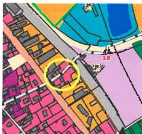
extrait de carte des enjeux de Loire/Rhône après modification