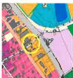
extrait de carte des enjeux de Loire/ Rhône avant modification