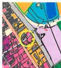
extrait de carte des enjeux de Loire/Rhône après modification

NB : pas de modification de la carte de zonage (zone urbanisée)